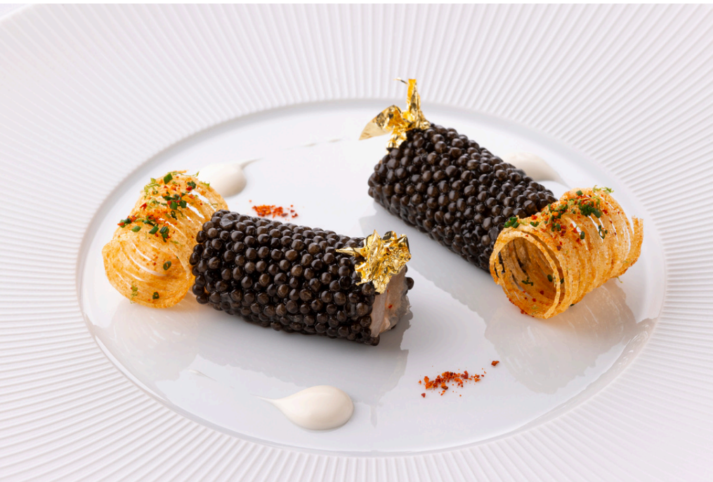
Le Tartare de Sar cannelloni de caviar