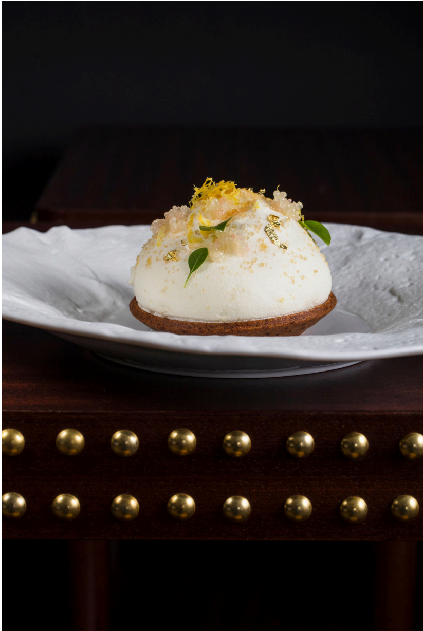
La tartlette citron, sorbet basilic