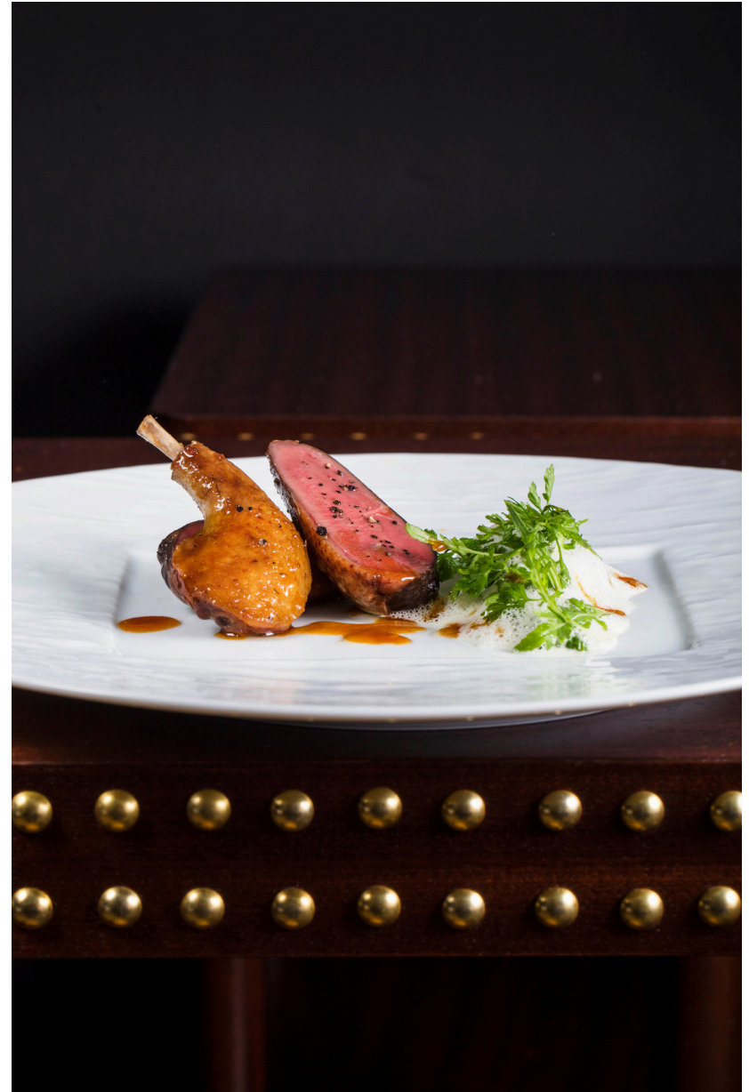
Le Pigeonneau et la Laitue, crémeux de parmesan