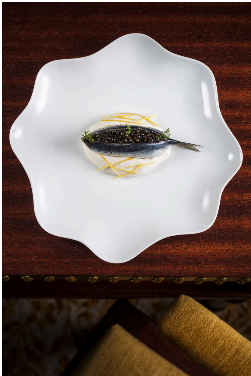
Sardine marinate con caviale e limone di Mentone