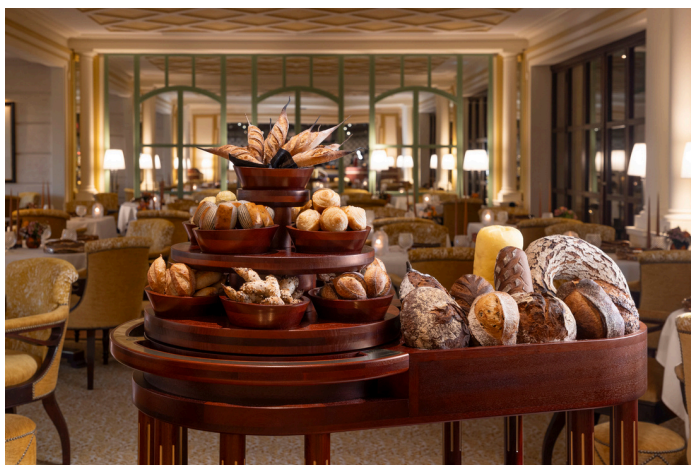
Il carrello di pane

Le creazioni di queste aree sono valorizzate da rituali che scandiscono il servizio, con l'apparizione di carrelli di pane e torte e altre dolcezze, per la gioia degli ospiti.