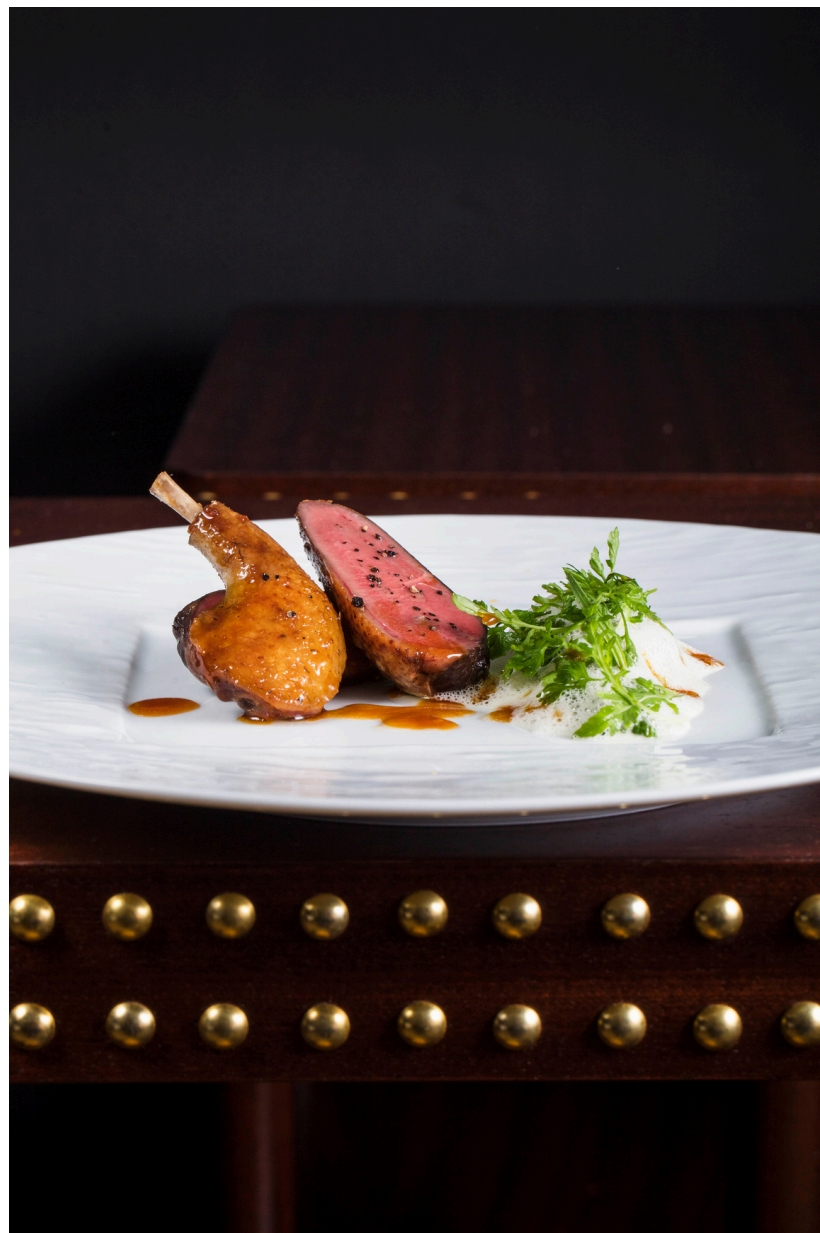
Piccione e lattuga, crema di parmigiano