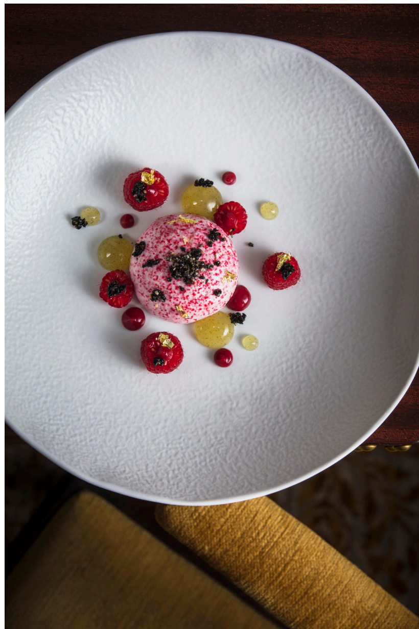
Il blanc-manger lamponi