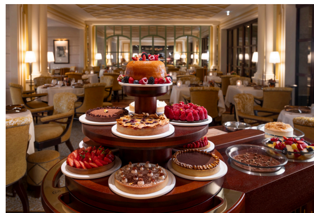
Il carrello di torte i dolci